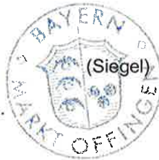
Thomas Wörz Erster Bürgermeister